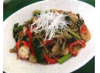
参考文献：作ってみたい韓国料理の本

チャブチェ(雑菜)は色とりどりの野菜をそれぞれの持ち味を生かした味付けにして和えた韓国料理です。韓国ではお正月などお祝の席にも出されるほど定番の一品です。