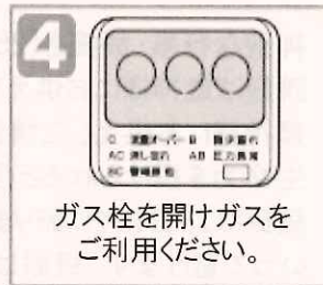
ガス栓を開けガスをご利用ください。

ガスの流れや、圧力などの異常やガス使用中に大きな地震があった場合など、マイコンメーターの安全機能が働きガスを自動遮断する場合がございます。その際は、マイコンメーター復帰方法にそって復帰ボタンを押してください。ガス漏れがないかマイコンメーターが安全確認を行い、異常がなければ、ガス止表示と赤く点滅しているランプが消えガスが使用できるようになります。復帰できない場合は復帰を繰り返さずにご連絡下さい。点検に伺います。