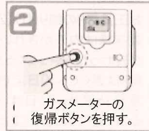
ガスメーターの復帰ボタンを押す。