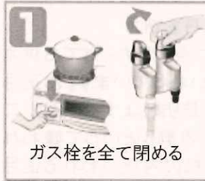
ガス栓を全て閉める